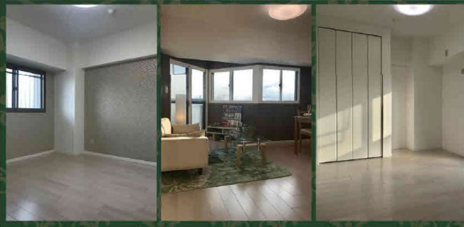
※内見の際は、必ず当社へご連絡下さい。尚、売却済みの場合はあしからずご了承ください。